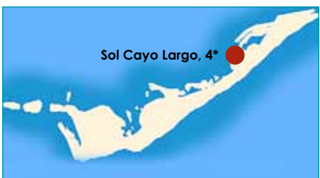
Sol Cayo Largo, 4*